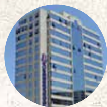
Torre La Florida