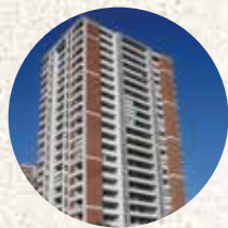
Condominio Grand vista